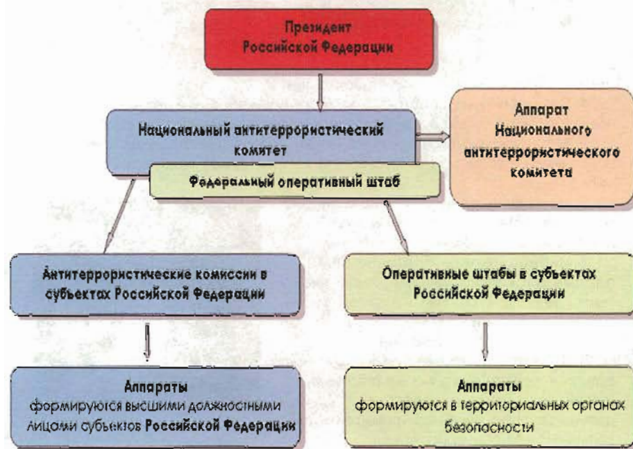
Схема координации деятельности по противодействию терроризму в Российской Федерации